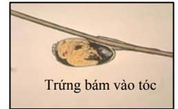
Trứng bám vào tóc

Chí có thể đến từ khắp mọi nơi... từ bạn học, từ ghế trong rạp xem phim, từ mũ nón hoặc áo khoác của một trẻ hàng xóm, từ việc dùng chung lược hoặc từ những sinh hoạt sau giờ học. Chí thường có trong độ tuổi học sinh và ngay cả những em sạch sẽ nhất cũng có thể dễ dàng bị lây chí. Chí không phải là một loại bệnh nguy hiểm, nhưng nhà trường cần sự hợp tác chặt chẽ của phụ huynh để phòng ngừa nó. Tôi sẽ rảnh hết sức mình để ngăn chặn việc chí lây lan trong nhà trường. Và kính xin quý phụ huynh hợp tác bằng cách thường xuyên kiểm tra đầu tóc của em, và làm theo các chỉ dẫn nêu trên nếu quý vị tìm thấy chí trên đầu tóc của em. Xin quý vị vui lòng gọi cho tôi nếu quý vị có bất kỳ thắc mắc nào.